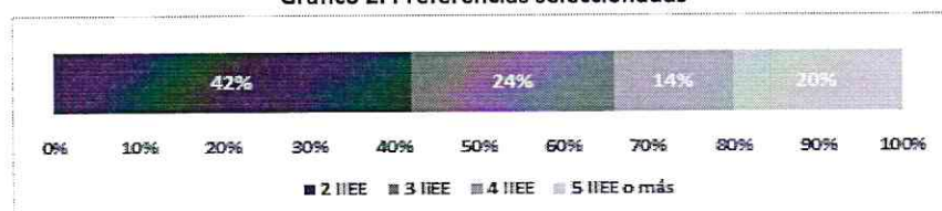
Gráfico 2. Preferencias seleccionadas

Asimismo, del total de postulantes, 2,880 (42%) eligieron solo 2 preferencias educativas, mientras que el 24% eligió tres colegios, 14% cuatro colegios y 20% eligió 5 colegios o más.